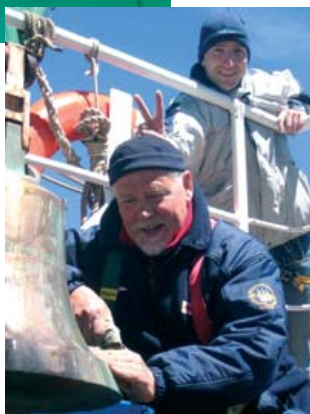
Trainee im Arbeitsdienst

Gegen fünf Uhr siegt entweder die Vernunft oder die Müdigkeit und wir verholen uns auf unsere Kojen. Das Frühstück lassen die „Null-Vierer“ generell ausfallen. Um elf Uhr wird die