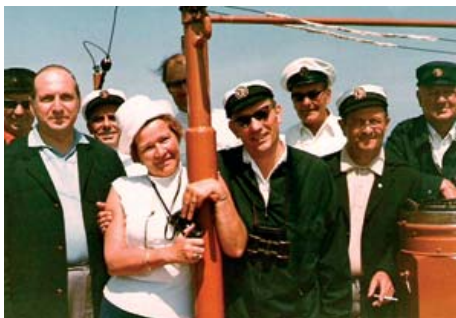
Kieler Woche 1968

Hundert Jahre sind ein Grund zum Feiern. Um so mehr, da seit fünf Jahren eine Crew ehrenamtliche Helfer dabei sind, das Schiff wieder flott zu machen. Der Verein Seglerhaus am Wannsee hat dem Kieler Schifffahrtsmuseum gratuliert.