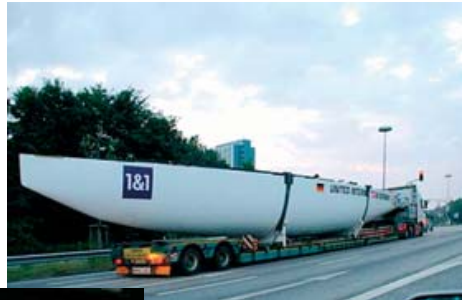
Im August 2006 im VSaW !